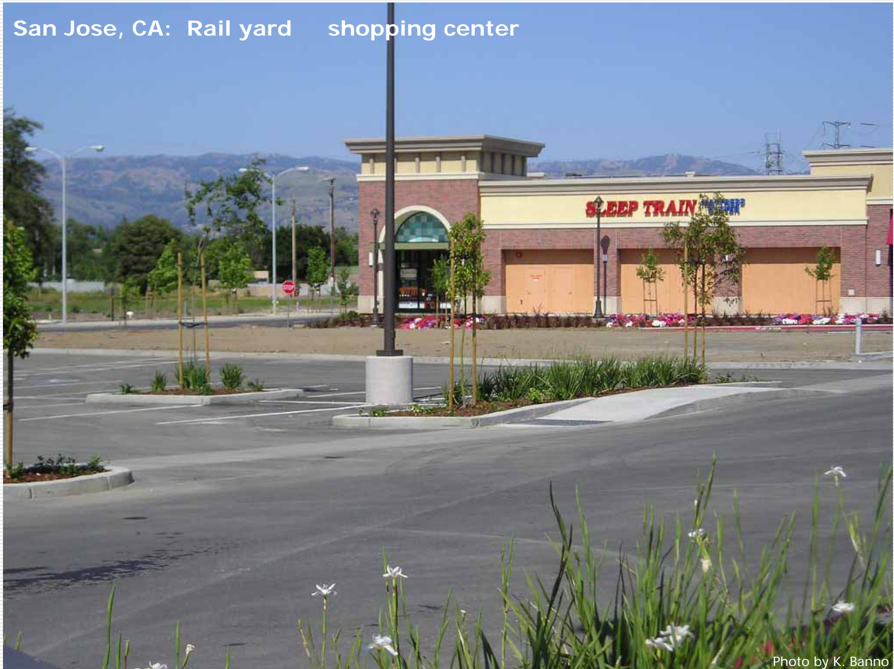
San Jose, CA: Rail yard shopping center